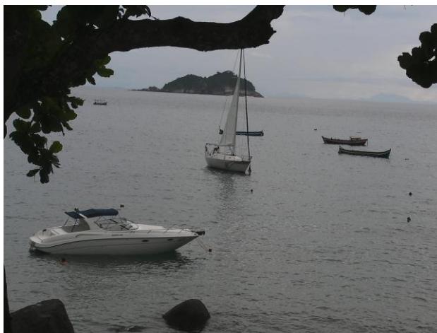
Figura 4 – Barco construído dentro da garagem de uma casa em Poá – SP.

Mapas vetoriais que são fornecidos pela Marinha Norte Americana serão introduzidos no sistema. Esses mapas têm várias camadas, que apresentam detalhamento maior a cada zoom. A Marinha do Brasil disponibilizará esse tipo de mapa digital e o sistema irá utilizá-lo.