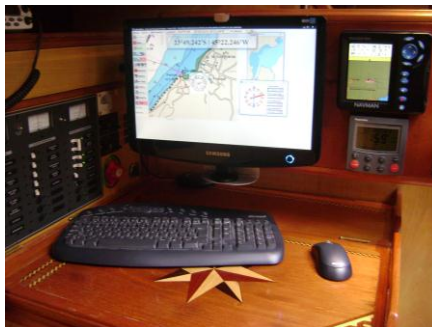
Figura 2 – Sistema instalado na mesa de navegação do barco

Pode-se observar no painel frontal da Figura 2 dois mostradores de equipamentos de bordo: o superior, do GPS Plotter com display LCD e, o inferior, do piloto automático. Os mostradores dos demais equipamentos de bordo (ecobatímetro, velocidade e direção do vento, velocidade sobre a água) estão na parte externa do barco para visualização do navegador, quando o mesmo estiver comandando sem o piloto automático.