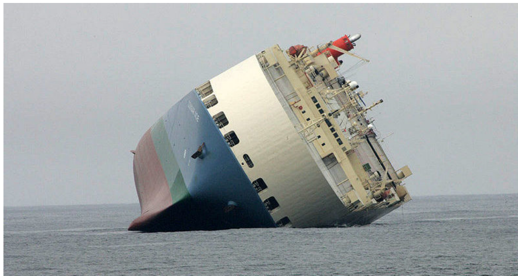
Imagem 1. Incidente do MV Cougar Ace durante troca da água de lastro.