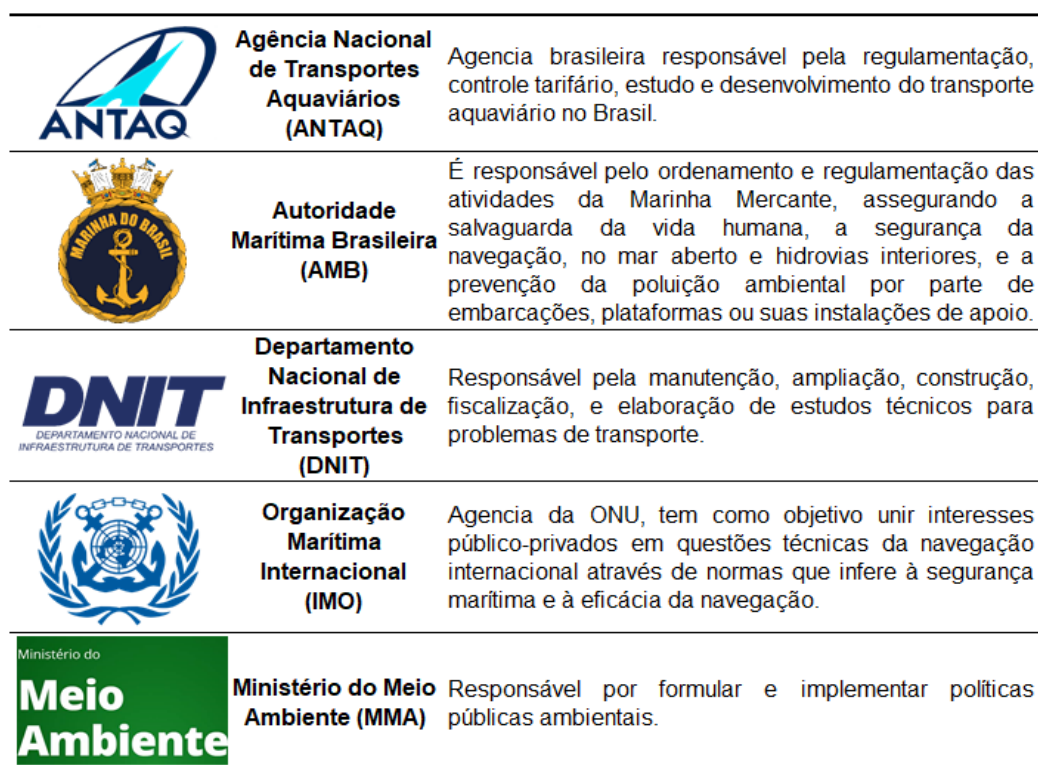
Tabela 1. Órgãos competentes.

Para uma navegação segura de fato acontecer, ministérios, órgãos, instituições e ONGs são movimentados para regulamentar e padronizar processos operacionais. Cada entidade contém atividades bem estabelecidas, conforme indicado na tabela 1.