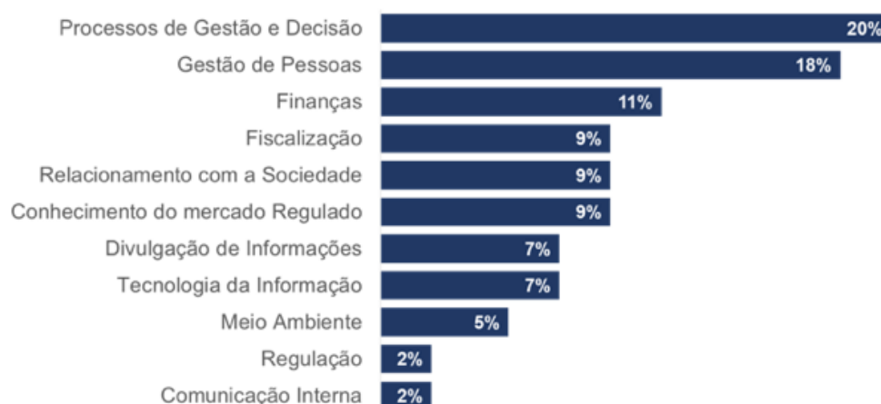
Gráfico 2. Distribuição das iniciativas estratégicas por temas e objetivos.